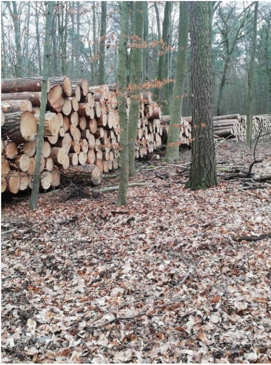
Anhang 1: Fotos vom 22.02.2023, aufgenommen im Jagen 94, Berliner Forsten, Revier Tegelsee